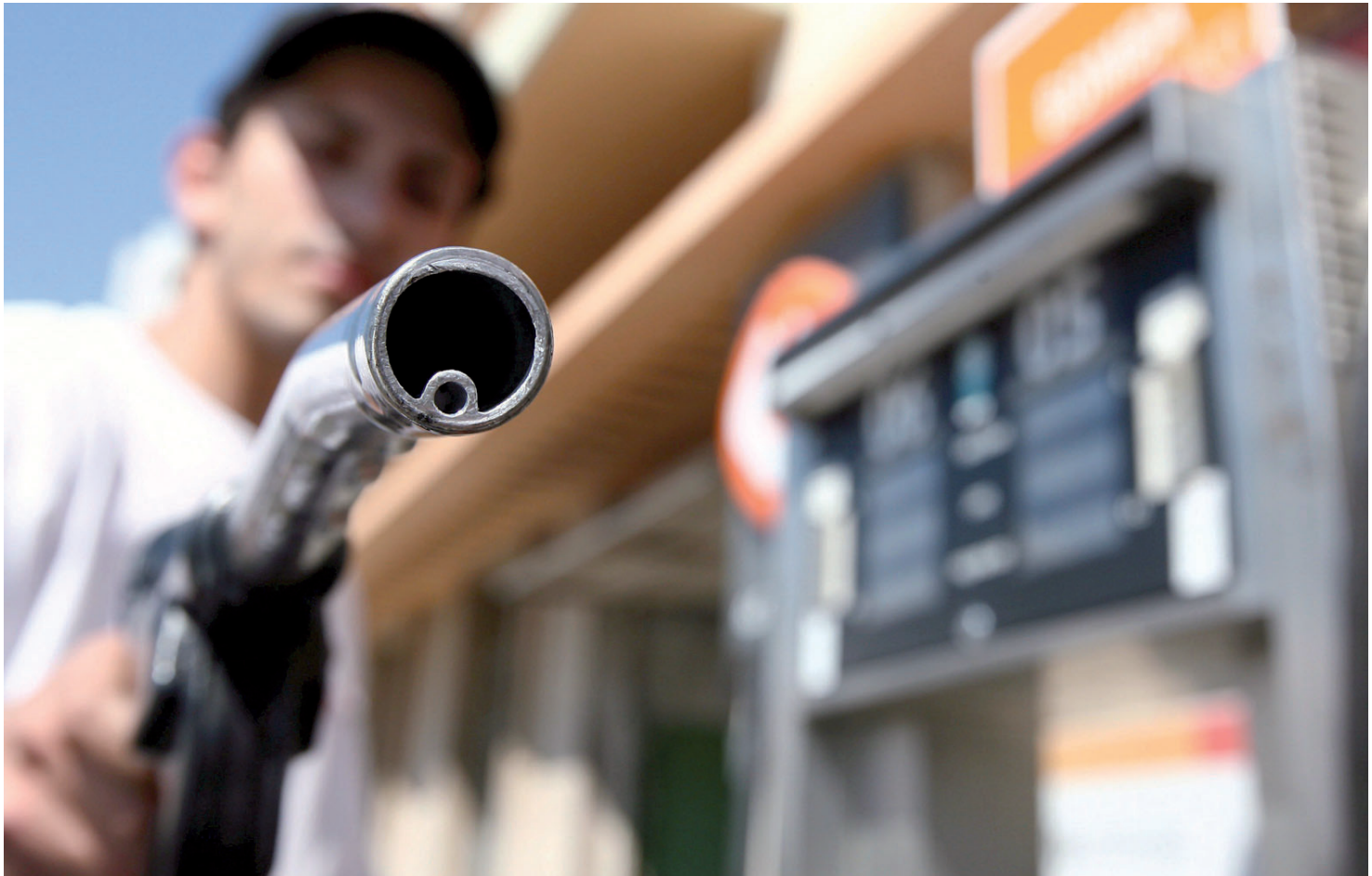
Geld her oder... Wie eine Bedrohung für den allgemeinen Wohlstand wirken die Benzin- und Dieselpreise an den Tankstellen.

74 Ausflugstipp Baden und Wandern: Exkursion an Calpes Küstenstreifen